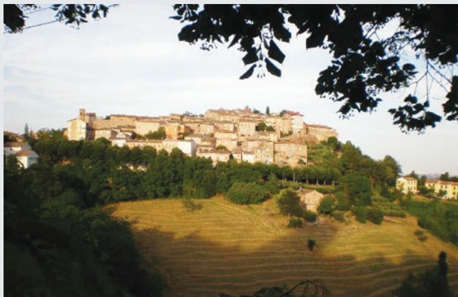
Una veduta di Penna San Giovanni, nelle Marche

Che grande paese è il mio paese con la campagna di terre scoscese, con i fiumi che fuggono per cercare il mare